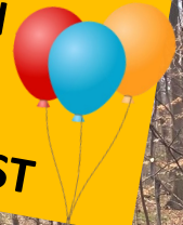
Gågruppen på tur i Anemoneskoven